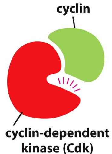
Figure 18-4 Essential Cell Biology, 4th ed.

A Cdk mindig jelen van a sejtben kb. konstans mennyiségben. A Cdk-n aktív centrum van, ami szerin/treonin kinázként működik, de csak ciklin jelenlétében mutat észlelhető aktivitást. Emiatt a Cdk a heterodimer katalitikus alegysége . A ciklin „csak” arra jó, hogy a Cdk-t aktiválja, tehát reguláris alegységként viselkedik, ezenkívül részt vesz a heterodimer szubsztrátspecifikálásának létrehozásában.